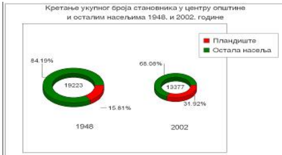
Графикон бр. 2 Кретање укупног броја становника